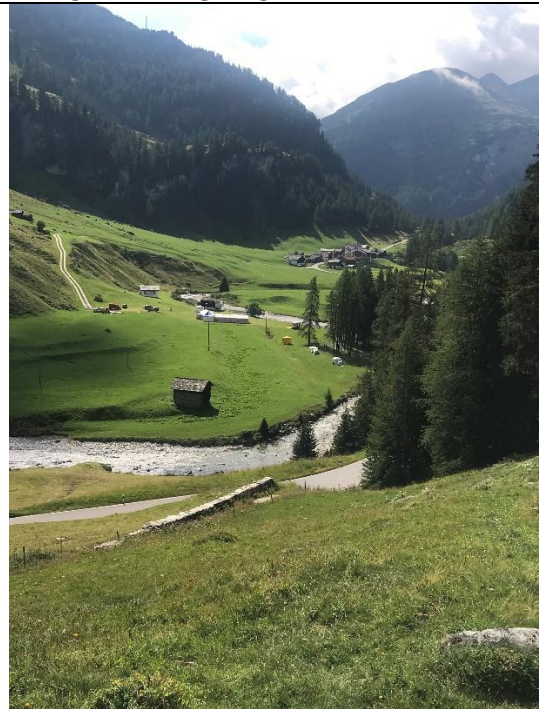
Blick das Tal hinauf nach Campsut